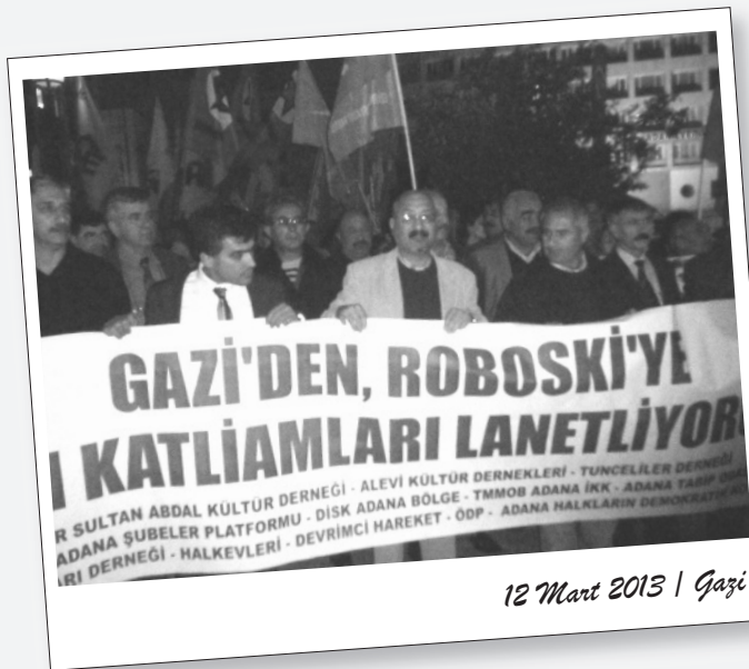
12 Mart 2013 | Gazi

Gazi Katliamı'nın 18. yıldönümünde, Adana'daki ilerici kurumlar tarafından eylem gerçekleştirildi.