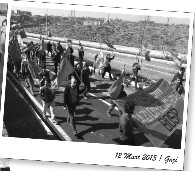
12 Mart 2013 | Gazi

Gazi Katliamı'nın 18. yılında, devrimci ve ilerici kurumlar eylemlerle katliamı lanetledi, direnişi selamladı.