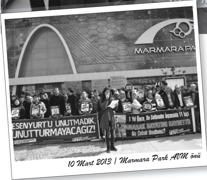
10 Mart 2013 | Marmara Park AVM önü

Sermaye, sömürü düzenini sürdürmek uğruna işçileri tehlikeli koşullara maruz bırakıyor, insani bir yaşam ve çalışma koşullarından mahrum ediyor. İşçiler bu koşullar altında yaşamlarını kaybetme tehlikesi altında sömürü çarkları içerisinde öğütülüyor. Bu koşullara karşı örgütlenerek karşı duran işçiler, insanca bir yaşam için mücadele yolunu tutuyor.